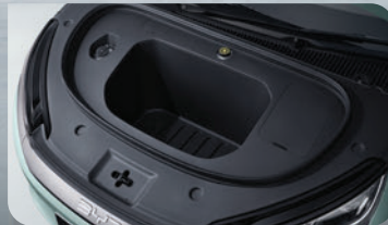
ที่เก็บสัมภาระด้านหลัง ขนาด 65 ลิตร หนึ่งในเดียวในคลาส