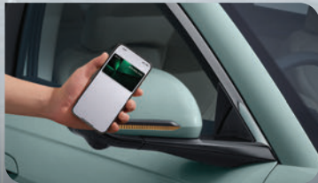
สะดวกสบายด้วยระบบกุญแจ แบบอิเล็กทรอนิกส์ BYD Digital Key และ NFC Card