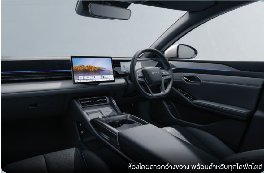
ห้องโดยสารกว้างขวาง พร้อมสำหรับทุกไลฟ์สไตล์