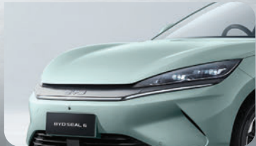
ไฟหน้า LED แบบ Full-Width