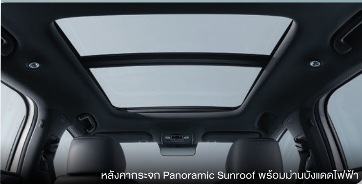
หลังคากระจก Panoramic Sunroof พร้อมม่านบังแดดไฟฟ้า