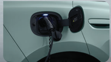
ระบบ VtoL พร้อม อุปกรณ์เสริม