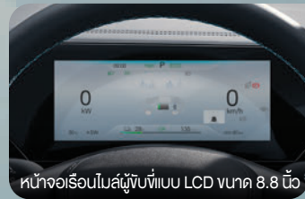
หน้าจอร่อนโมโนสีผู้ขับขี่แบบ LCD ขนาด 8.8 นิ้ว