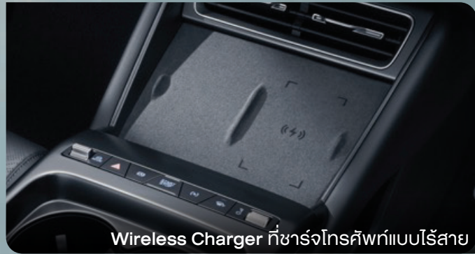
Wireless Charger ที่ชาร์จโทรศัพท์แบบไร้สาย

อัปเดตทุกการใช้ชีวิต ด้วยนวัตกรรมแห่งความ สะดวกสบาย พร้อมยกระดับทุกไลฟ์สไตล์ให้ เหนือกว่าที่เคย