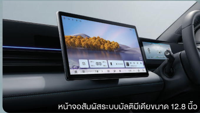
หน้าจอสัมผัสระบบมัลติมีเดียขนาด 12.8 นิ้ว