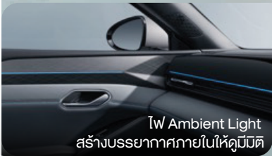
Tw Ambient Light สร้างบรรยากาศภายในให้ดูมีมิติ